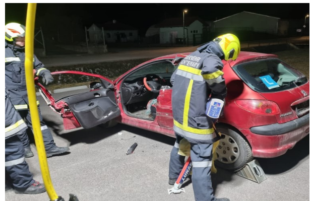
19.2. Übung mit hydraulischem Rettungsgerät