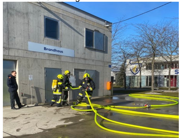
29.11. Atemschutzübung im Brandhaus/Tulln