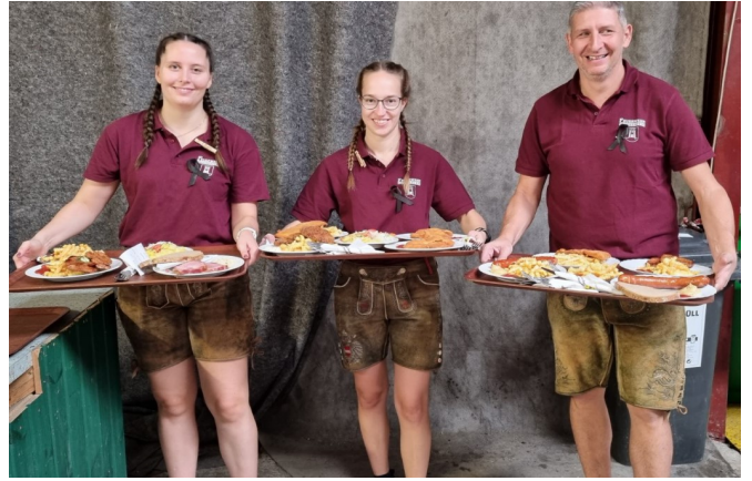
11. & 12.10. Feuerwehrroktoberfest