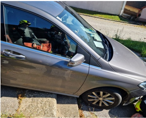
3.9. Techn. Einsatz PKW fährt über Stiegen