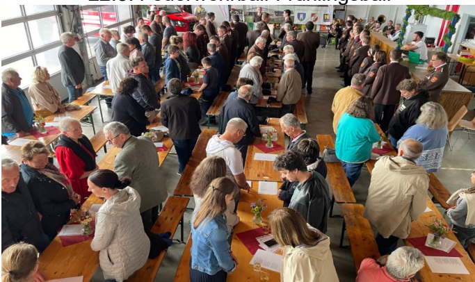
1.6. Festveranstaltung und Feuerwehrheuriger