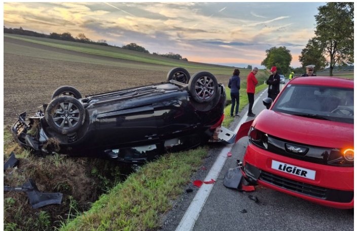
11.9. Techn. Einsatz PKW Bergung