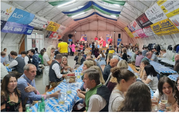
11. & 12.10. Feuerwehrroktoberfest