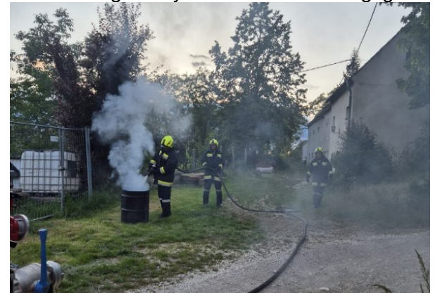
16. 5. Übung im Stationsbetrieb