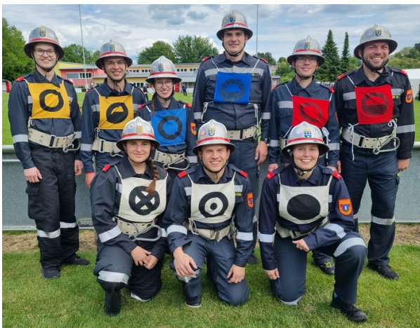
24.5. Wettkampfgruppe in Wilfersdorf