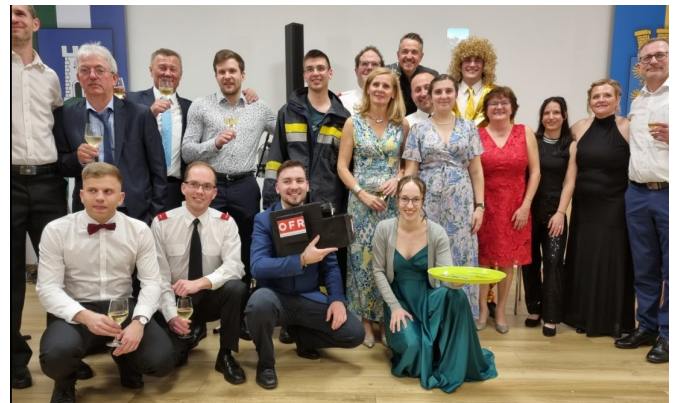
Teilnehmer der Mitternachtseinlage