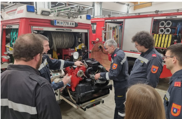
31. Jänner - Geräteschulung