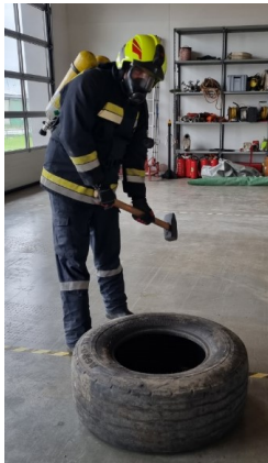
25.4. Leistungstest für Atemschutzgeräteträger