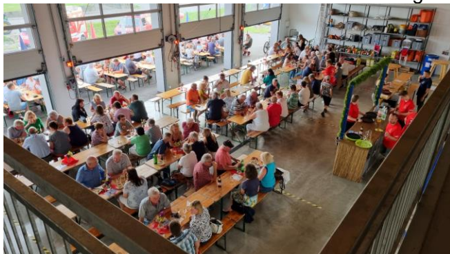
7. – 9.6. Feuerwehrreueiger FF Altlichtenwarth - Jahresrückblick 2024