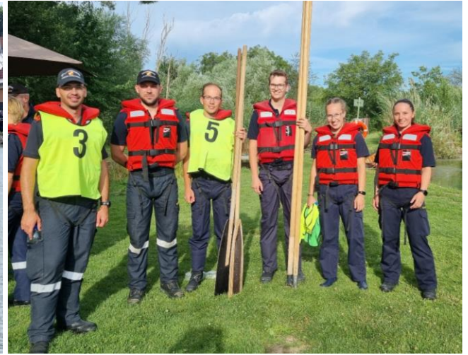
6.7. Bezirkswasserdienstleistungsbewerb in Katzelsdorf