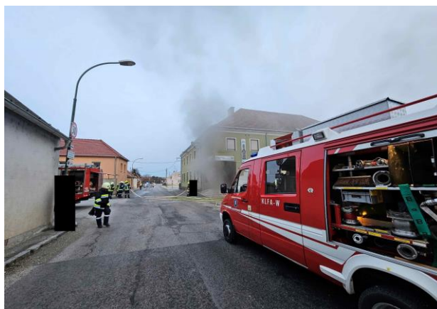
9.2. Brandeinsatz Disco Sachs