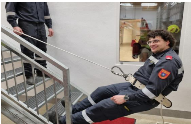
22.3. Rettung aus Höhen