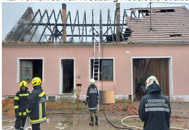
12.9. Brandeinsatz in Bernhardsthal