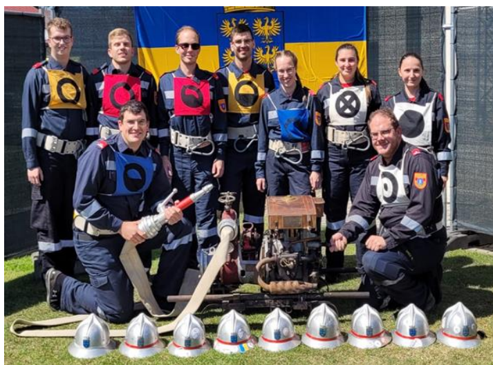
15.6. Bewerbungsgruppe in Kettlasbrunn