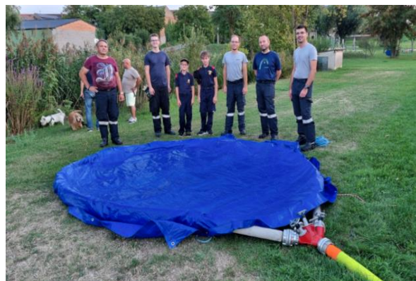
30.8. Bau eines Gefahrgutbehältnisses