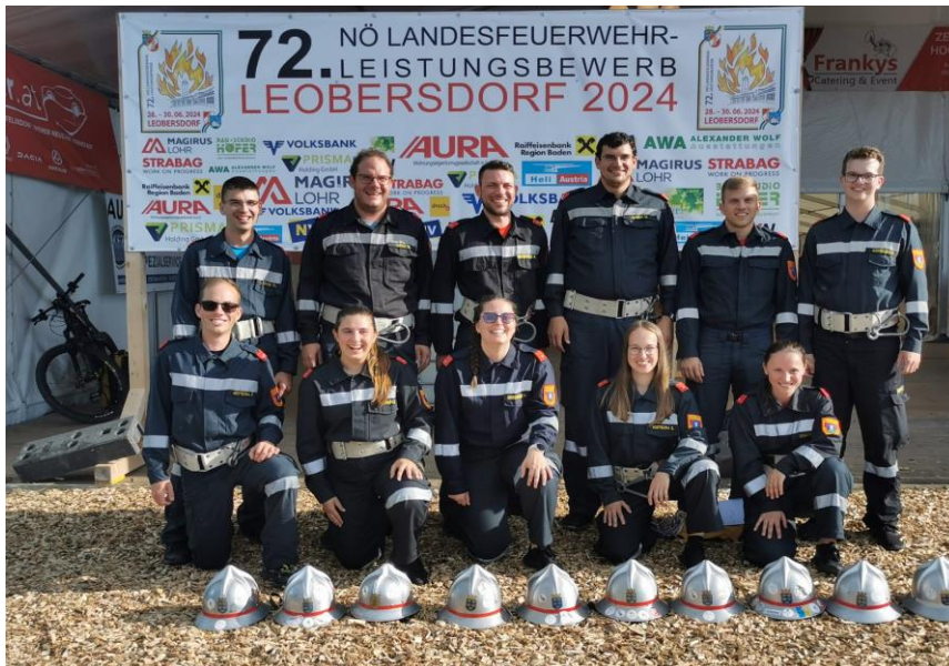
Unsere Wettkampfgruppe am Landesfeuerwehrleistungsbeiwerb