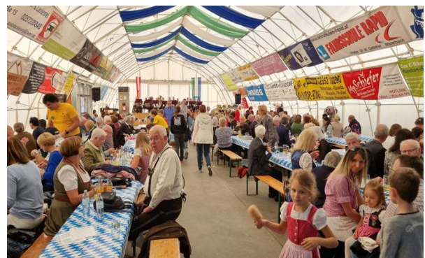
28. – 29.9. Feuerwehrroktoberfest