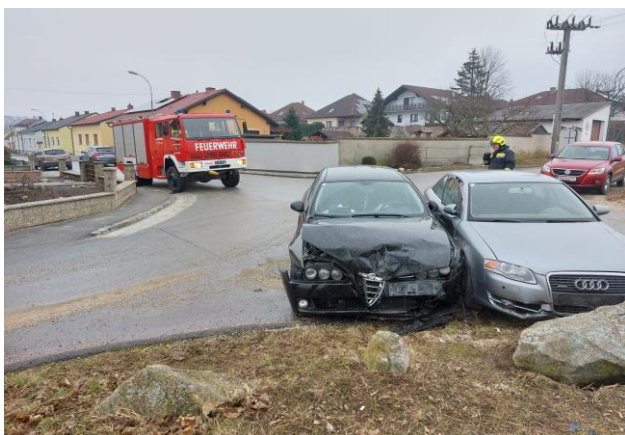
1.2. Verkehrsunfall Kreuzung Neusiedlerstraße