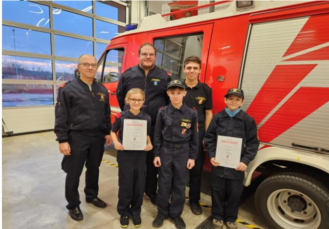
Foto nach der Erprobung

Zusätzlich wurden (per Stand 28.11.2024) 28 FJ - Stunden abgehalten.