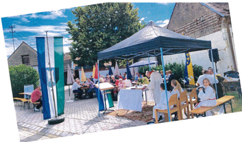
Christophorusfeier am Parkplatz vor dem Jugendheim