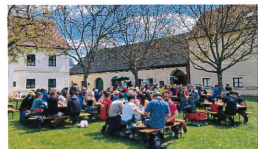
Volles "Haus" im Pfarrhofgarten