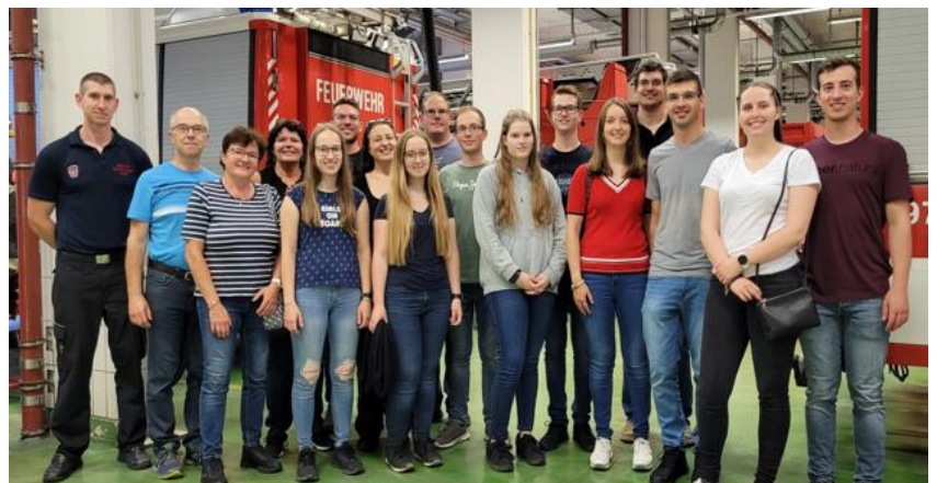
10.6. Besuch der Berufsfeuerwache Floridsdorf