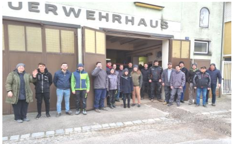
..... Tag der Übersiedlung .....