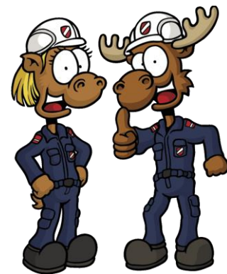
Am Schnuppertag der Feuerwehrjugend am 16.9. konnten Kinder die Arbeit der Feuerwehr kennenlernen und auch ausprobieren.