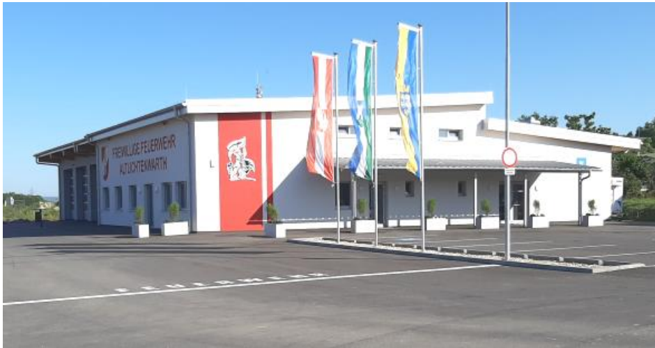
Neubau Feuerwehrhaus und Gemeindesaal am 4. Juni eröffnet