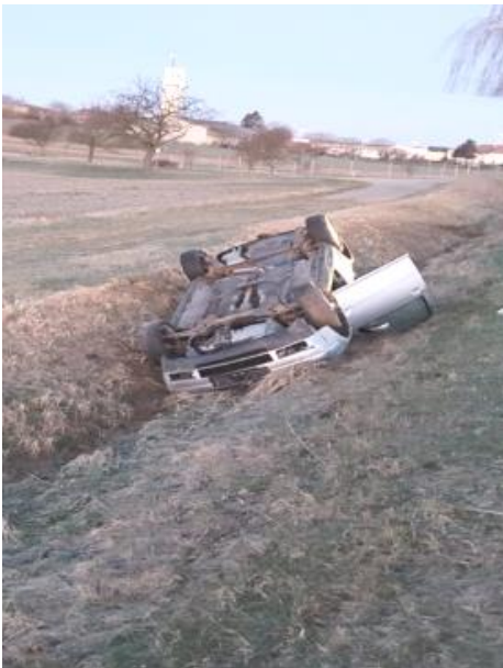
12.3. Verkehrsunfall Richtung Hausbrunn