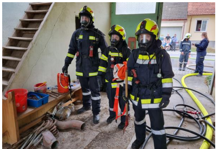
14.10. Brandeinsatzübung in Althöflein