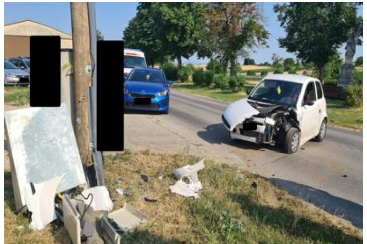
9.7. Verkehrsunfall Richtung Hausbrunn