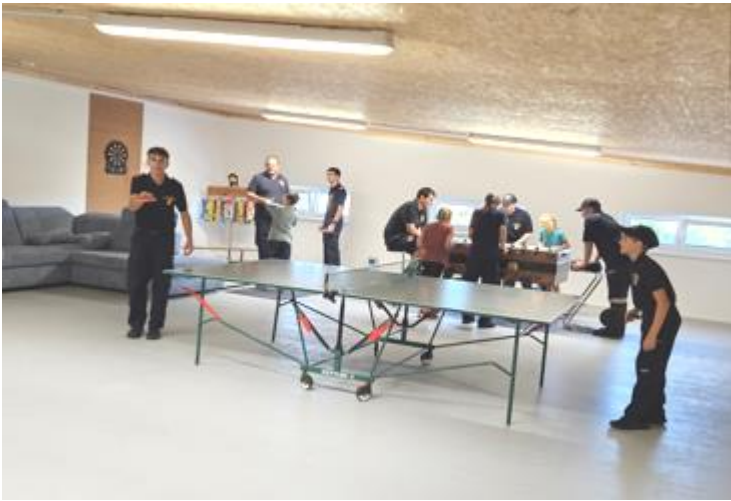
Seit heuer hat auch die Feuerwehrjugend einen eigenen Raum für die Ausbildung aber auch für die Freizeitgestaltung für die fast wöchentlich stattfindenden Jugendstunden.