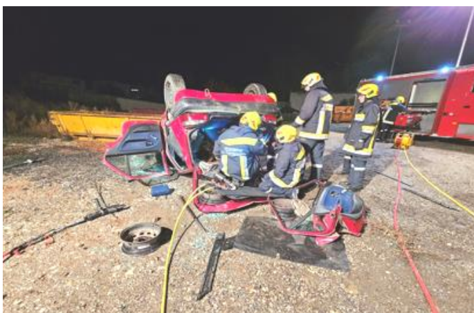
27.10. Übung mit hydraulischen Rettungsgerät