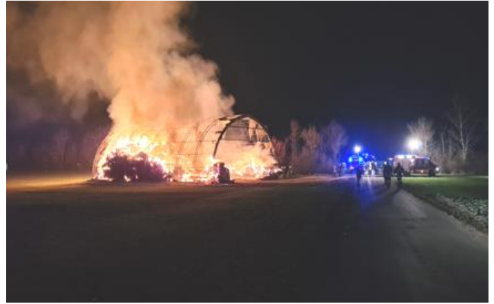
1.3. Scheunenbrand in Althöflein