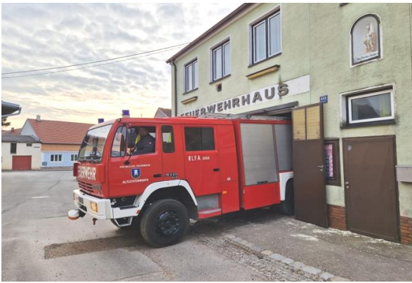
Letzte Ausfahrt und .....