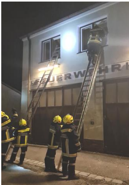
17.3. Rettung über Leitern