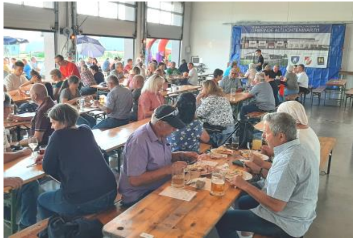
2. und 3. Juni - 1. Heuriger im Feuerwehrhaus