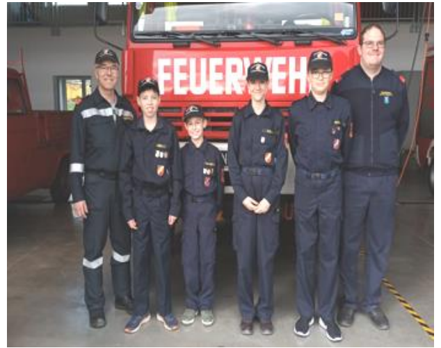
Feuerwehrjugend mit Kommandant und Jugendbetreuer