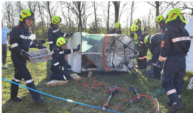
22.4. Übung am Flugfeld