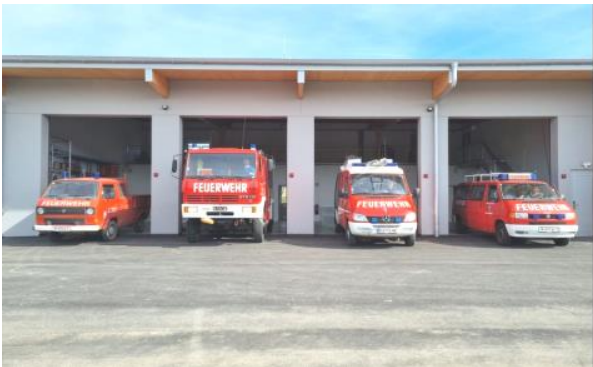
..... in die neue Garage am 11.2.2023