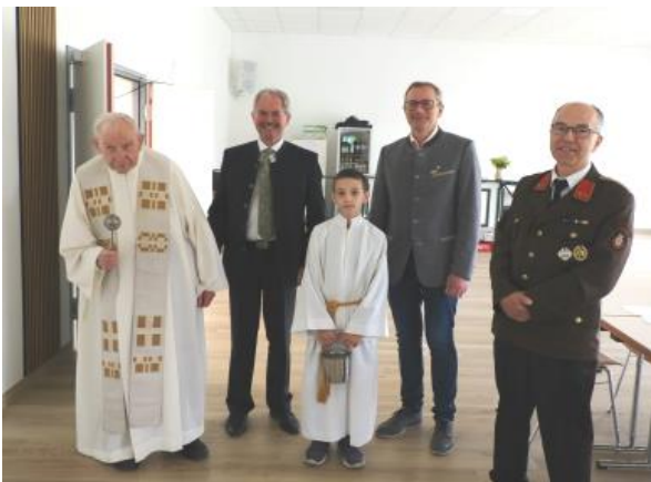
Segnung mit Eröffnungsfeier