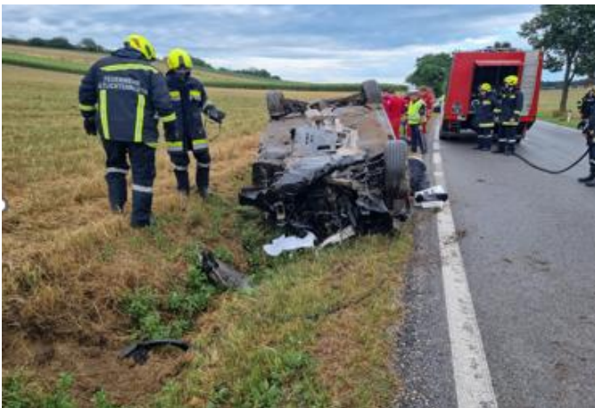
4.8. Verkehrsunfall Richtung Hausbrunn