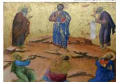
VERKLÄRUNGSMOMENTE: In denen mich Gottes Wort erreicht, Begehrungen mit Menschen, die mir Gott erschließen lassen; Augenblicke, in denen ich spüre: Gott wirkt auch durch meine bescheidenen Angebote.

» Und er wurde vor ihren Augen verwandelt; sein Gesicht leuchtete wie die Sonne und seine Kleider wurden blendend weiß wie das Licht. Da erschienen plötzlich vor ihren Augen Mose und Elia und redeten mit Jesus. Und Petrus sagte zu ihm: Herr, es ist gut, dass wir hier sind. «